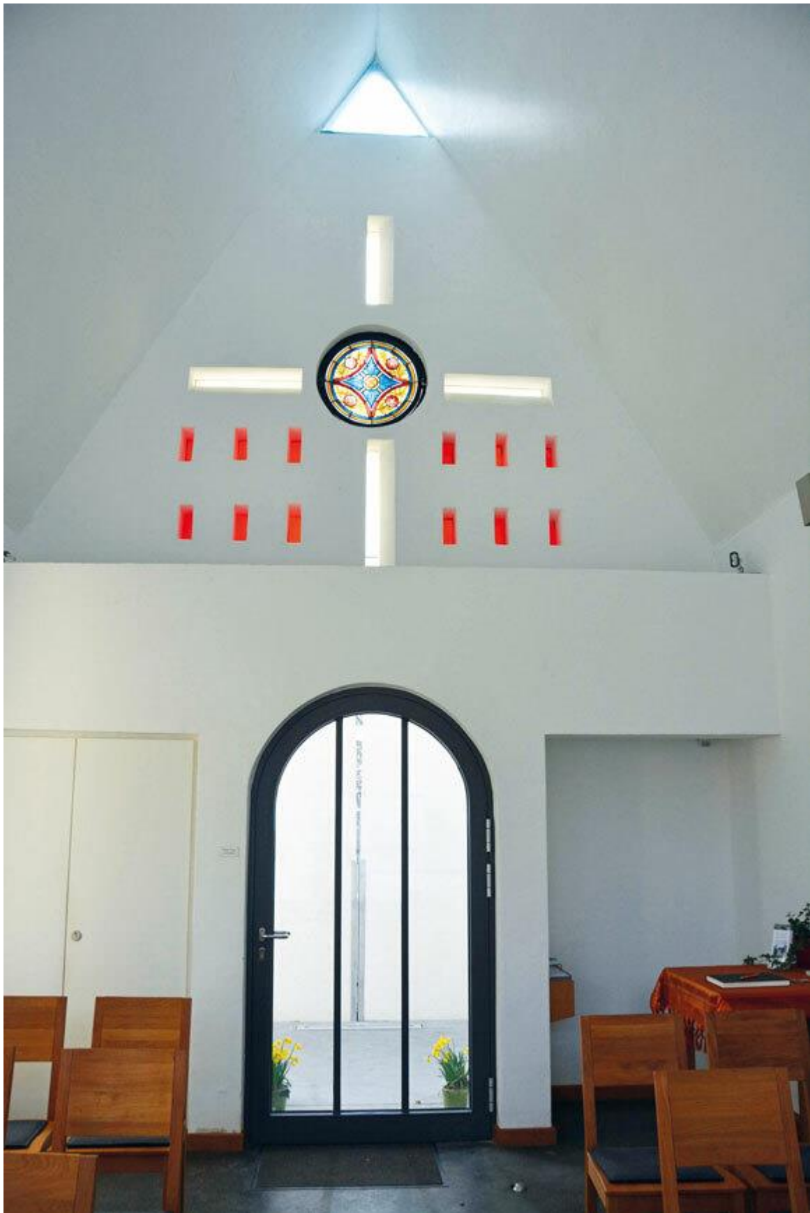
Den Innenraum der neuen Kapelle schmückt ein Fenster aus der alten Kirche.