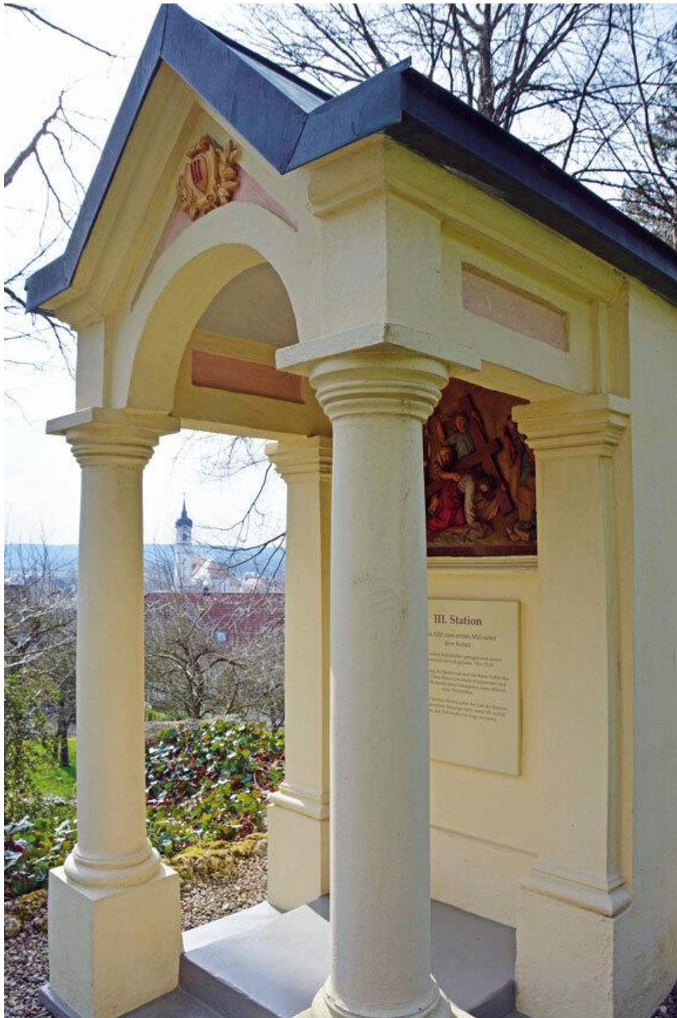
Vom Kreuzberg blickt man hinunter auf das Dorf und die Kirche St. Johannes Evangelist

2006 sanierte der Förderverein die 14 Stationen des Kreuzbergs und die Grotten in 2500 Arbeitsstunden aufwändig und baute die Wege behindertengerecht aus. Mit Schubkarren wurden mehr als 50 Tonnen Schotter transportiert. Zusammen mit der 2012/13 vollendeten Neugestaltung mitten im Wohngebiet über der Umlach entstand ein Ensemble, das das ganze Jahr über gut besucht wird, wo Maien- und Advents-Andachten und vieles mehr stattfinden.